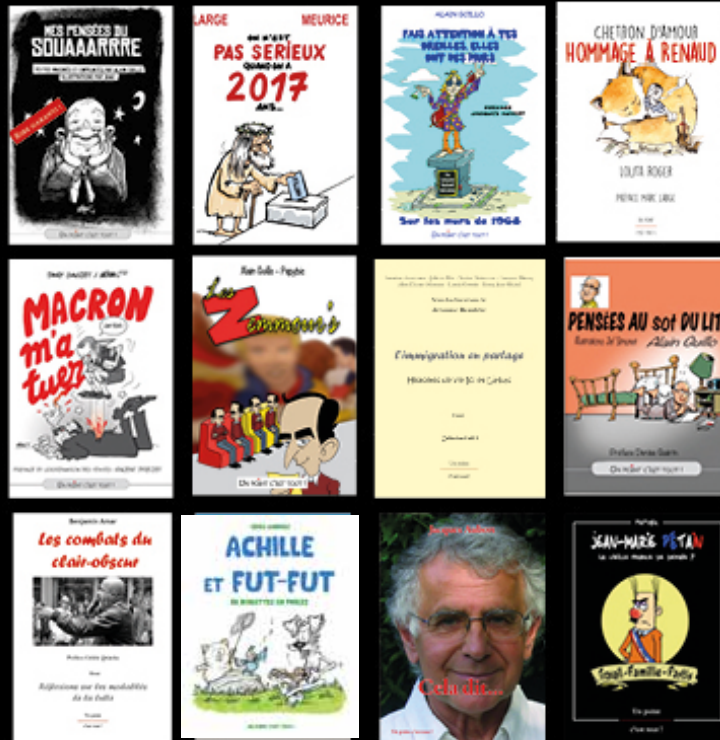
Nos affiches format 400X600 mm