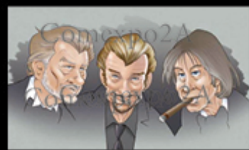
Illustration: Alain Guillo