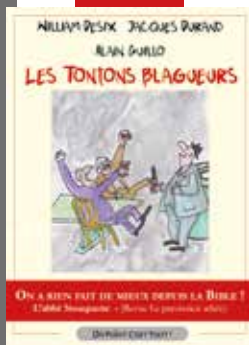
Illustration de la couverture ©Camille Durand

William Desix- Jacques Durand - Alain Guillo